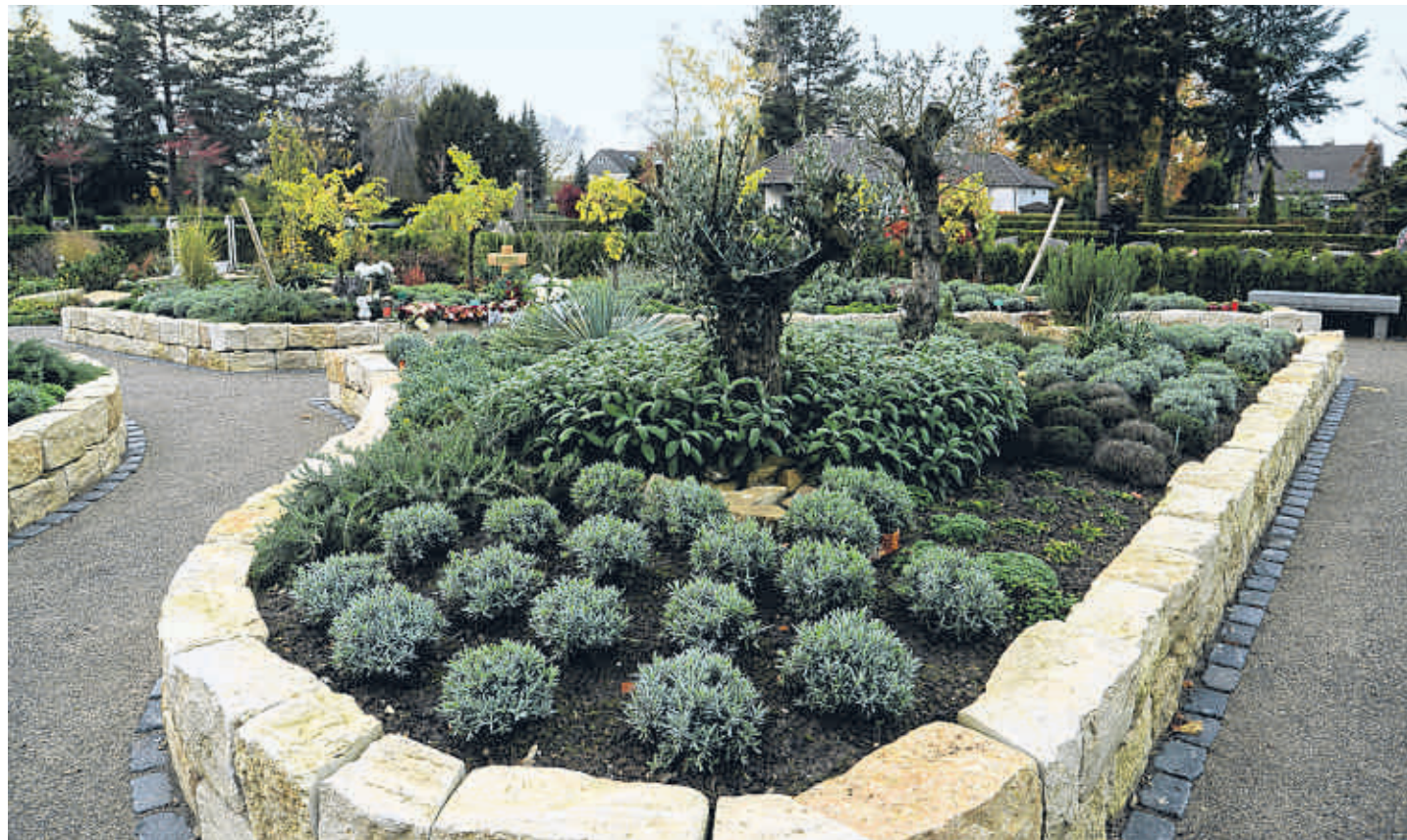
Der Bestattungsgarten auf dem Porzer Friedhof an der Alfred-Nobel-Straße wurde im Mai dieses Jahres angelegt.

Für eine Beerdigung im Sarg müssen Angehörige in Porz tief in die Tasche greifen. „Selbst anonyme Urnen-Bestattungen kosten hier ein kleines Vermögen“, sagt Glahn. Mehr als 1500 Euro würden alleine die Bestattungskosten betragen. Die Gebühren für das Krematorium und für die Kosten für die Urne dazugerechnet, komme man auf mehr als 3000 Euro, sagt der Unternehmer. In Troisdorf